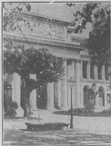
Fachada principal del Museo de Pintura.